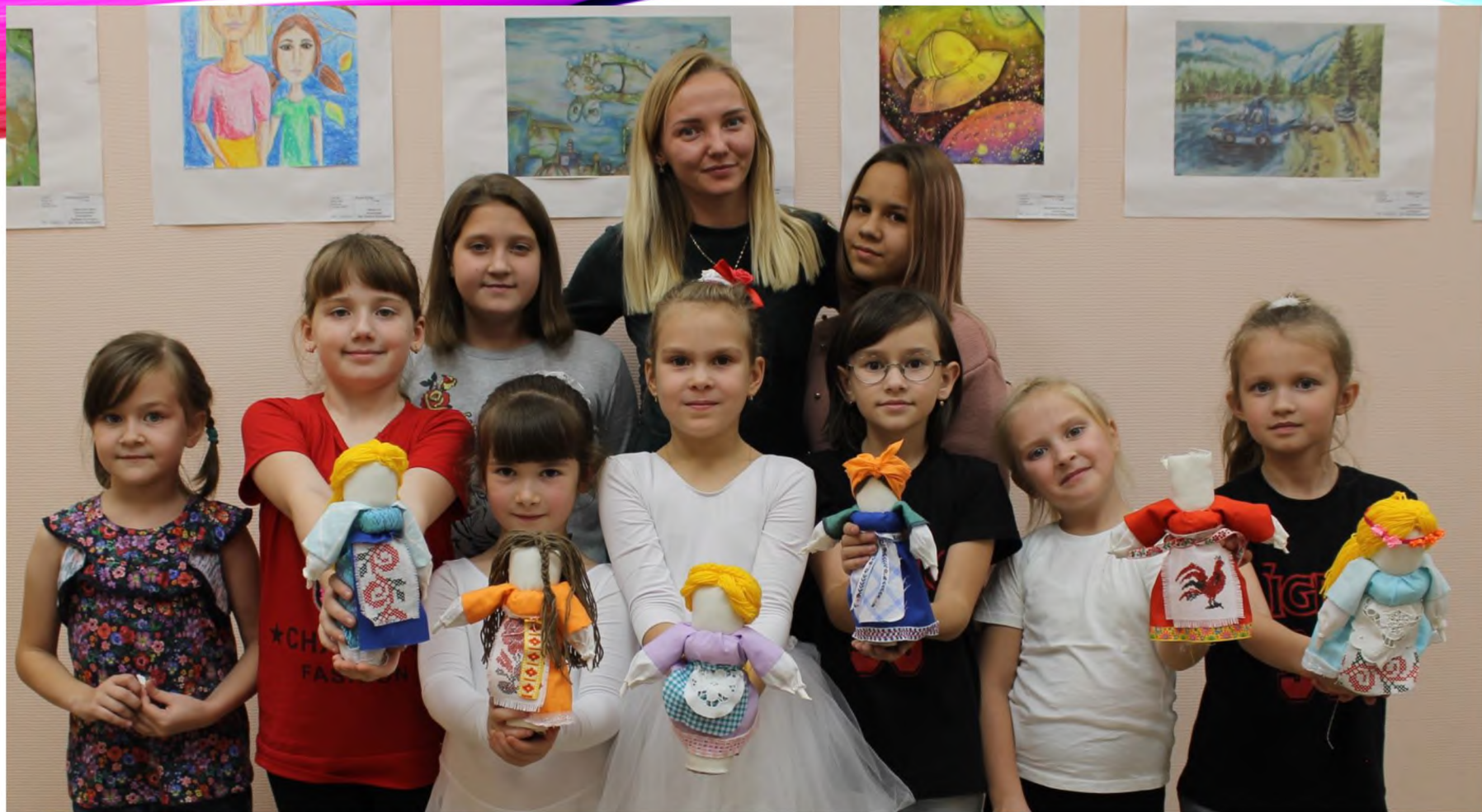
Участники ДПИ «Рукодельница»