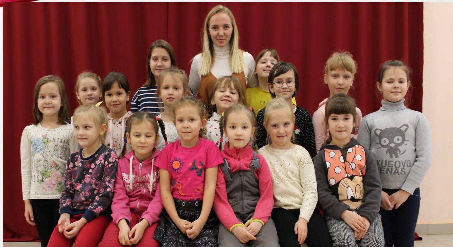
Участники ДПИ «Рукодельница»