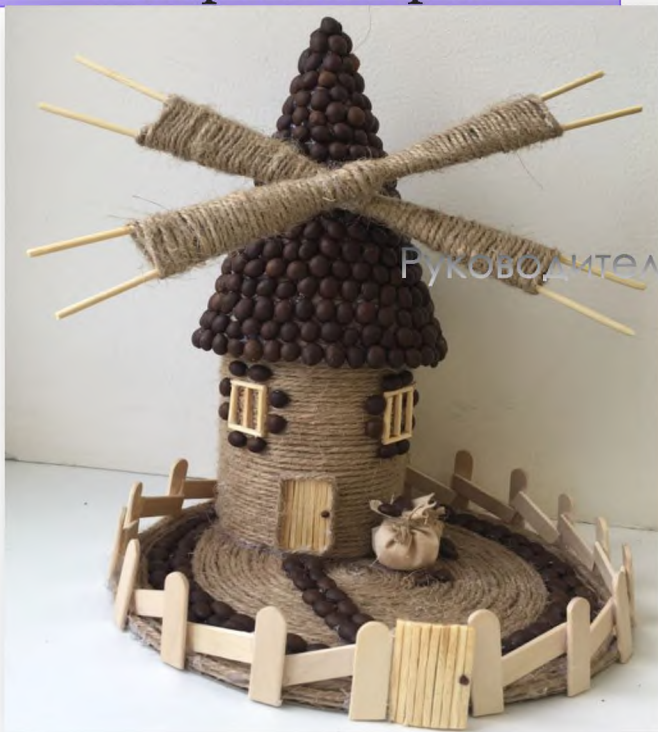
Мельница из жута и кофейных зерен