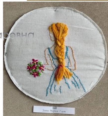
Работы учениц ДПИ «Рукодельница»