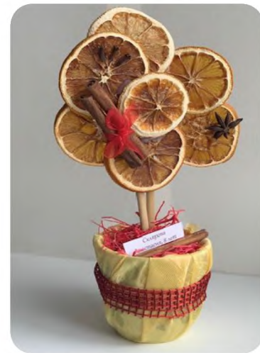
Работы учениц ДПИ «Рукодельница»