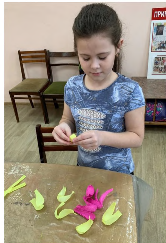
Участники ДПИ «Рукодельница»