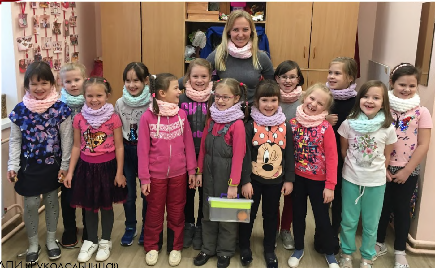
Участники ДПИ «Рукодельница»