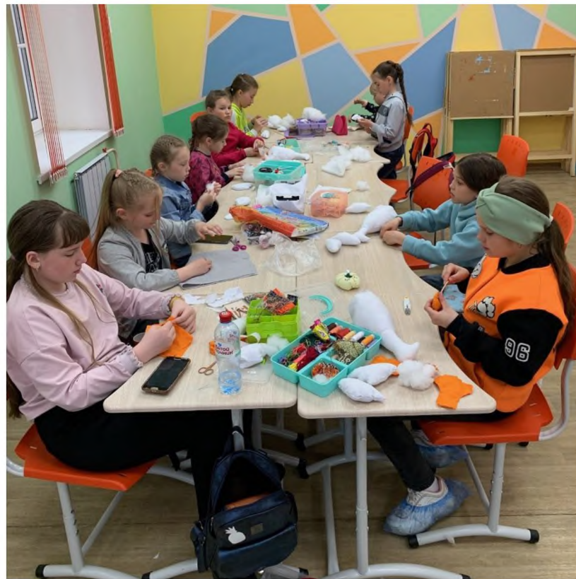
Участники ДПИ «Рукодельница»